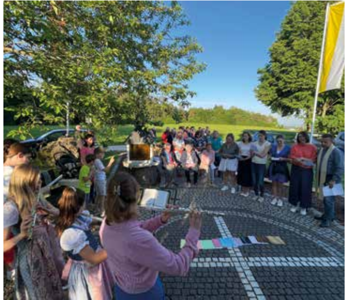
Bei der ersten Maiandacht - organisiert vom Katholischen Burschenverein - an der Nassenfeler Nikolauskapelle beteiligten sich neben den Kommunionkindern auch die örtlichen Vereine mit ihren Fahnenabordnungen. Musikalisch umrahmten die Schuttertaler Musikanten die Andacht.