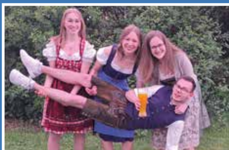
Aufstieg in Bezirksliga