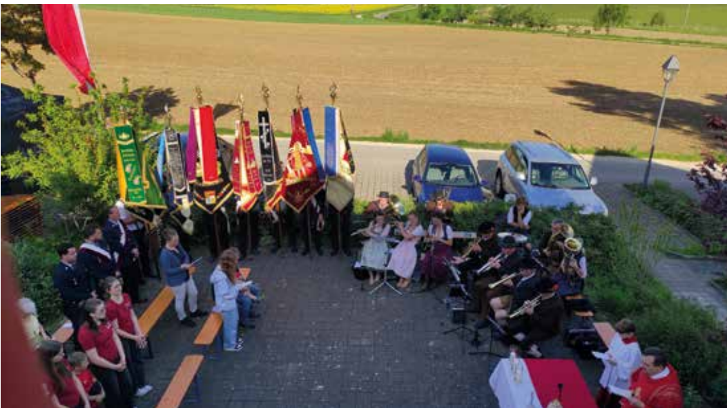
Auch heuer feierte die Feuerwehr Meilenhofen-Zell wieder ihr traditionelles Floriansfest am 11.05.2024. Bei herrlichen Wetter feierten wir, zu den Klängen der Meilenhofener Blasmusik den Nachbarfeuerwehren aus Nassenfels, Wolkertshofen, Biesenhard, Ochsenfeld und den beiden Ortsvereinen, Schützen und Kriegerverein. Nach der Messe klang der Abend bei gemütlichen Beisammensein aus.