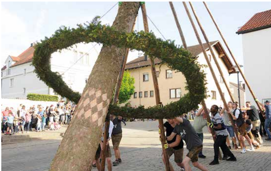
Egweil (hpg) Mit vielen Helfern und zahlreichen Besuchern wurde in Egweil am Dorfplatz von der Feuerwehr und dem Burschenverein der Maibaum aufgestellt. Heuer zierte ihn erstmals ein eingeschnittenes Rautenmuster.