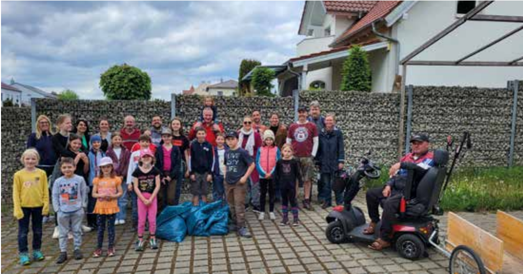
Bei der Ramadama-Aktion in Wolkertshofen wurden die Fluren rund um das Dorf gesäubert. Zum Abschluss bedankte sich der Obst- und Gartenbauverein bei den zahlreichen fleißigen Helfern mit einer Pizza.