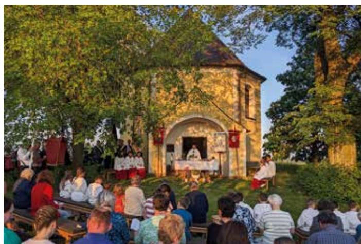
Bei der ersten Maiandacht - organisiert vom Katholischen Burschenverein - an der Nassenfeler Nikolauskapelle beteiligten sich neben den Kommunionkindern auch die örtlichen Vereine mit ihren Fahnenabordnungen. Musikalisch umrahmten die Schuttertaler Musikanten die Andacht.