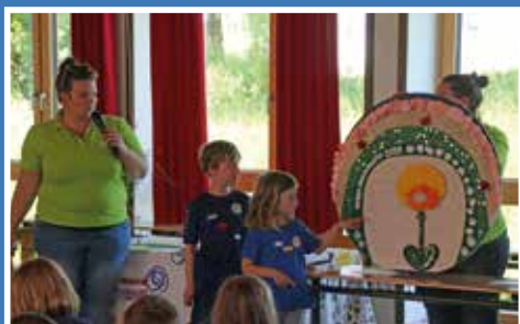
Kinderbibeltag in Adelschlag