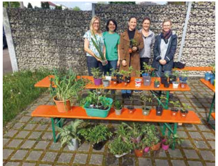
Der Obst- und Gartenbauverein Wolkertshofen hat eine Pflanzenbörse am Feuerwehrhaus durchgeführt.

Jeder der am Tennistraining teilnehmen möchte, kann sich gerne unter folgender Nummer melden: 015114994349 Weitere Infos werden dann persönlich mit den jeweiligen Interessenten besprochen. Es freut sich die Vorstandschaft der Abteilung Tennis FC Nassenfels.