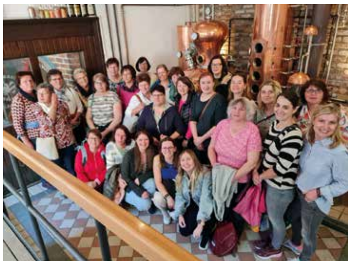
Der Frauen- und Mädchenverein Nassenfels besuchte die Frankenmetropole Nürnberg. Im Zuge der Führung durch die Stadt und die Katakomben stellte sich die Reisegruppe zu einem Foto auf.