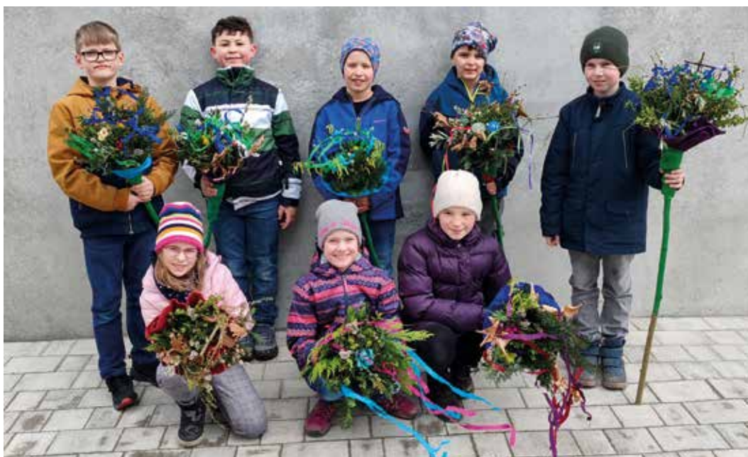
Ein Teil der Nassenfels und Wolckertshofener Kommunionkinder trafen sich am 23.4 zum gemeinsamen Binden ihrer Palmbüschen.

Bevor Schneider sich bei seiner gesamten Vorstandschaft für die geleistete Arbeit bedankte blickte er auf das anstehende Jahr: Auch 2024 wird der Verein zu den naheliegenden Wandertagen mit einer Gruppenmeldung beteiligen. Zudem ist im September eine Drei-Tages-Fahrt in den Harz geplant. (Ankündigung haben Sie schon erhalten). Mit dem Leitmotto ‚Gott zum Gruß - Gut zu Fuß‘ beendete Schneider die Versammlung.