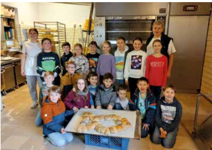
Die Bäckerei Bauer hat die Kommunionkinder aus Nassenfels und Wolkertshofen in die Backstube eingeladen und hat mit ihnen zum Thema ‚Unser täglich Brot gib uns heute‘ gezeigt, wie Brot und Semmeln gebacken werden. Zum Abschluss durften alle Teilnehmer noch Semmeln für zu Hause backen.