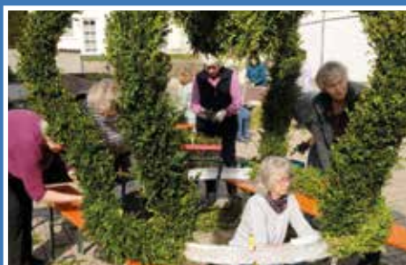
Prachtvolle Osterkrone in Egweil