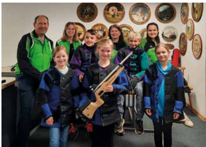
Beim Schnupperschießen durfte sich der Schützenverein Schuttertaler Heide Egweil über einige interessierte Nachwuchsschützen freuen. Alle die bei unserem Schnupperschießen keine Zeit hatten, aber dennoch Interesse haben, können sich gerne bei uns melden. Infos sind unter www.schuttertaler-heide-egweil.de in der Rubrik Anfänger zu finden.