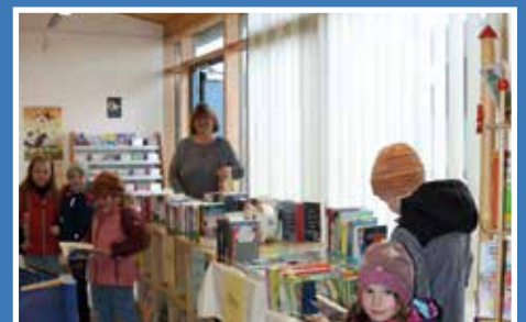
Büchereitag in Nassenfels