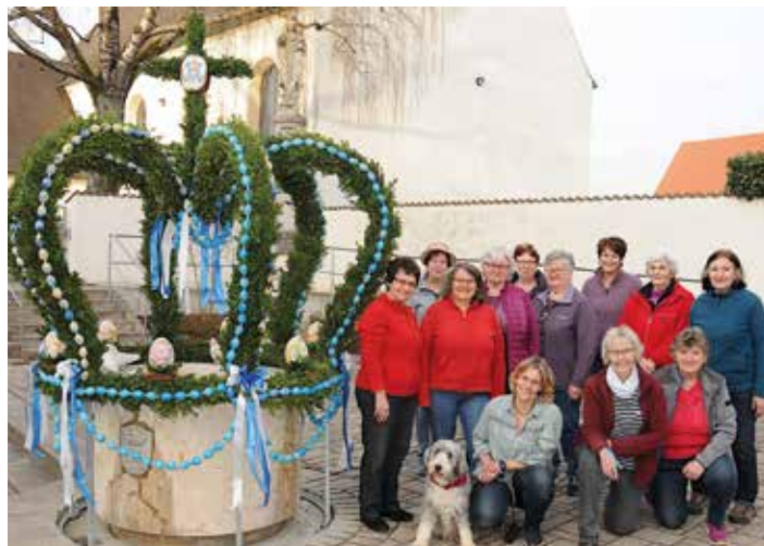
Egweil (hpg) Eine prachtvolle Osterkrone ziert den Egweiler Dorfbrunnen am Gemeindezentrum. Die Landfrauen aktiv haben ihn liebevoll gestaltet und geschmückt.