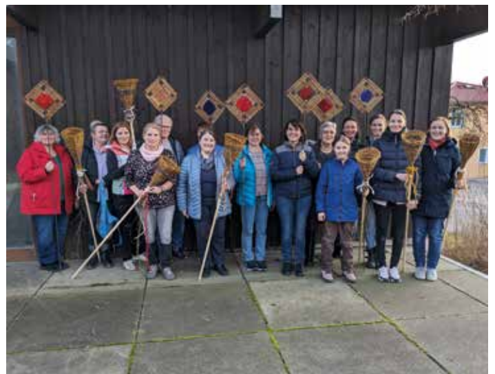
Rechtzeitig vor dem Frühlingsstart haben 14 Frauen unter fachkundiger Anleitung Rauten beziehungsweise ein Körbchen aus Weiden geflochten und so die erste Gartendeko für den anstehenden Frühling gebastelt.