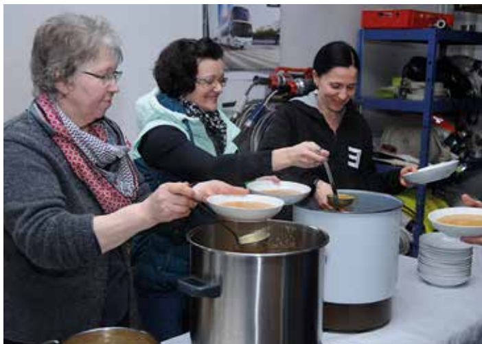
Egweil (hpg) Mit einer Fastensuppe nach dem Gottesdienst, zu der alle Egweiler ins Gemeindezentrum eingeladen waren, erinnerte der Egweiler Pfarrgemeinderat an die Fastenzeit und das bevorstehende Osterfest.