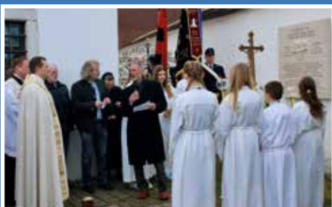
Einweihung Gedenkstein in Möckenlohe