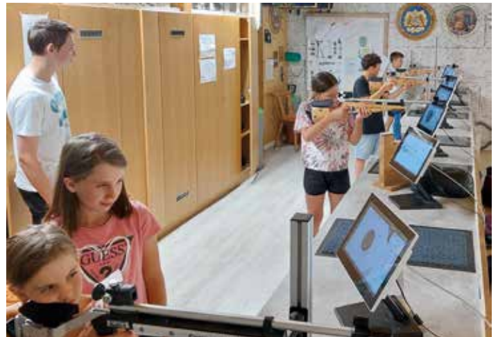
Ferienaktion beim SV Tilly Wolkertshofen - Schnupperschießen mit dem Lichtgewehr