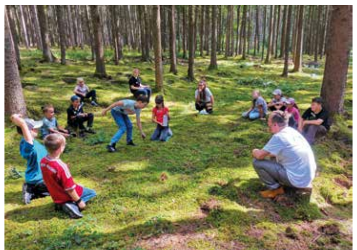
Viel Spaß hatten die 12 Kinder beim Ferienprogramm „Im Wohnzimmer von Fuchs, Reh, Dachs und Wildschwein“. Gemeinsam mit drei Wald- und Wildnispädagogen von wort-voll entdeckten sie Tierknochen, Federn und eine Ameisenautobahn, übten sie sich im Schnitzen und lernten spielerisch interessante Eigenschaften von verschiedenen Waldtieren kennen.