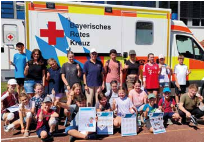
Der Markt Nassenfels hat mit dem BRK - Eichstätt zwei Erste Hilfe Kurse im Rahmen des Ferienprogramms organisiert.