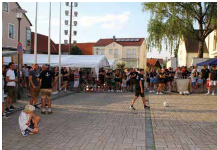
Impressionen vom Egweiler Dorffest 2024 organisiert vom Schützenverein Schuttertaler Heide Egweil