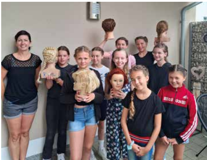
Im Rahmen des Ferienprogramms des Markt Nassenfels waren zehn Mädchen im Steffi's Haarstudio und absolvierten einen Flechtkurs. Im Laufe des Vormittags zeigte die Friseurmeisterin verschiedene Techniken, welche die Kinder im Anschluss auch gleich aneinander ausprobierten.