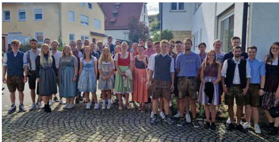
Foto von der gemeinsamen Busfahrt der Freiwilligen Feuerwehren Nassenfels und Adelschlag zum Tittinger Kellerfest 2024.

dukte aus der Region erwerben. Der Tag klang gemütlich im Hofcafe der Familie Prem aus, wo vor der Heimfahrt mit dem Bus noch eine Stärkung eingenommen wurde.