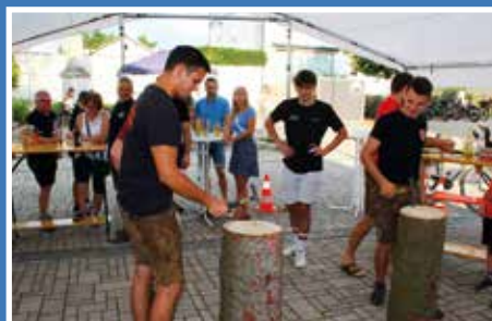
Dorffest in Egweil