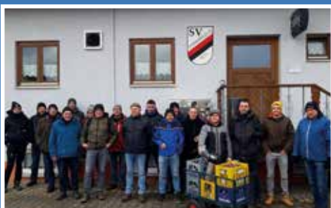
Winterwanderung SV Ochsenfeld