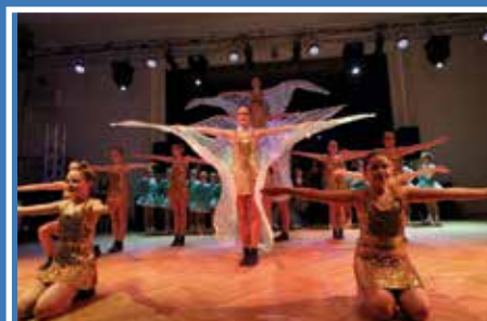
Fasching in Egweil