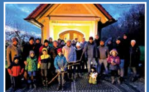
Neujahrswanderung Krieger- und Kameradschaftsverein Nassenfels