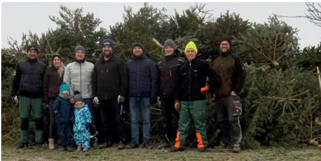
Auch heuer konnte die Freiwillige Feuerwehr Pietenfeld wieder eine beträchtliche Menge an ausgedienten Christbäumen in Pietenfeld und Weißenkirchen einsammeln. Das Foto zeigt die fleißigen Helfer und im Hintergrund weit mehr als 100 Christbäume, welche nun als Hackgut enden werden.